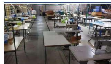
Emergencia económica Uno de cada tres empleados estará en paro o en ERTE EDUARDO MAGALLÓN