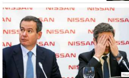
Nissan no aclarirà el seu futur a Catalunya fins abans de les vacances d'estiu